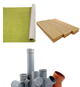
Rebuts de bricolage