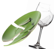
Les débris de vaisselle