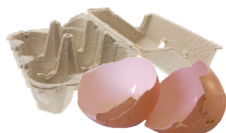
Coquilles & boîtes d'œufs (écrasées et en morceaux)