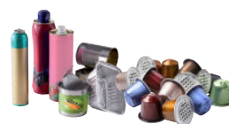
Les emballages en métal, même les petits