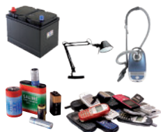
Piles, petits objets ménagers électriques ou électroniques