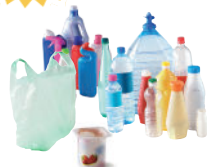
Les emballages en plastique