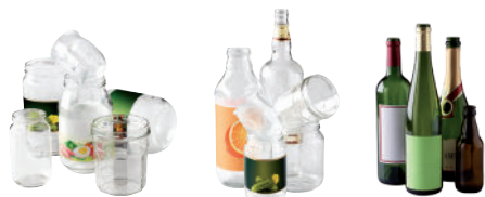
Bouteilles, pots, bocaux

En vrac, sans bouchon ni capsule ou couvercle. Uniquement entre 8h et 21h.