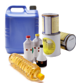
Huiles alimentaires, peintures et produits toxiques