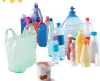
Les emballages en plastique