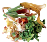
Épluchures, fruits & légumes gâtés