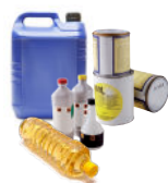
Huiles alimentaires, peintures et produits toxiques