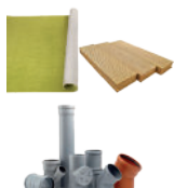
Rebuts de bricolage