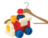
Les petits objets cassés