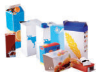
Les emballages et briques en carton