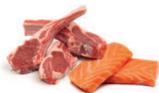
Déchets de viandes et poissons crus