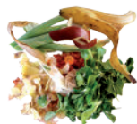
Épluchures, fruits & légumes gâtés