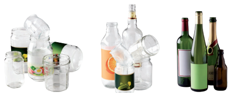
Bouteilles, pots, bocaux

En vrac, sans bouchon ni capsule ou couvercle. Uniquement entre 8h et 21h.