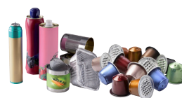
Les emballages en métal, même les petits