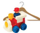
Les petits objets cassés