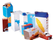
Les emballages et briques en carton