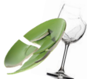
Les débris de vaisselle