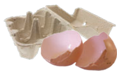
Coquilles & boîtes d'œufs (écrasées et en morceaux)