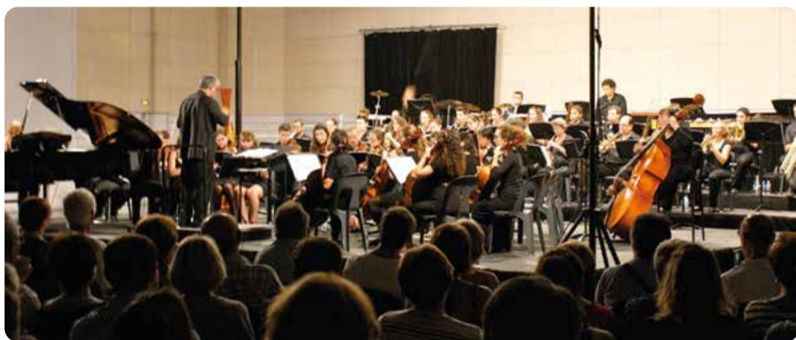
Jazz symphonique à Mazères-Lezons

G âce au partenariat entre la Mairie, la Communauté d'agglomération Pau-Pyrénées et le Conservatoire de Musique et de Danse à rayonnement départemental, grâce à l'implication des élus de la municipalité et des bénévoles du Comité des Fêtes, un concert symphonique a été organisé pour reverser la recette au profit de France AVC 64, association qui se bat pour la prévention des risques d'Accidents vasculaires cérébraux (AVC). ●