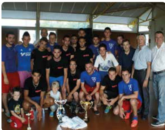
Les vainqueurs du tournoi

D eux journées de bonne humeur et de soleil pour le traditionnel tournoi inter-quartier de juin organisé par l'ASMUR. Rien n'a manqué pour ce rendez-vous traditionnel à Mazères-Lezons qui réunit les plus anciens et les plus jeunes : 21 équipes se sont engagées dans un jeu de football de qualité... y compris une équipe féminine venue de Jurançon et qui a connu un franc succès. La fin du tournoi principal a été marquée par la compétition entre la formation gelosienne face à l'équipe mazéroise du Sulky qui a finalement emporté la victoire ! ●