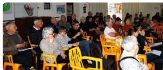
Assemblée générale du Centre Social

À l'occasion d'une assemblée générale, les adhérents ont baptisé le Centre social : il se nomme désormais le « Cap de Tout ». Très important aussi, de nouveaux statuts ont été voté, statuts qui donnent enfin et définitivement une nouvelle légitimité au Centre social qui devient désormais une association totalement indépendante, aussi bien pour sa gouvernance que pour sa responsabilité dans sa gestion financière. La Mairie de Mazères-Lezons reste propriétaire des locaux mais occupe dorénavant la stricte place qui lui revient dans la légalité en tant que financeur : elle détient trois sièges au Conseil d'administration