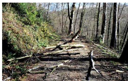
La tempête Xynthia a fait des dégâts dans les bois.

On se souviendra longtemps des catastrophes de la tempête Xynthia de la fin février 2010.