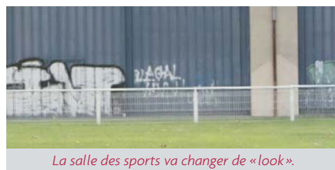
La salle des sports va changer de « look ».

En échange de cette « vitrine » remarquable, l'Association « VeryGoodColorz » qui recherche des supports publics pour exercer mais aussi promouvoir son art du « graph », réalisera gracieusement cette fresque pour la commune de Mazères-Lezons.