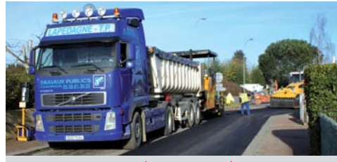
La municipalité entretient la voirie.

Début 2009, la voirie communale a subi de très importantes dégradations, à cause des déviations de la circulation liées aux travaux réalisés sur la D37 au carrefour De Gaulle/Rue du 8 mai 1945 (changement des réseaux, création d'un tourne à gauche et remplacement des tuyaux d'égouts).