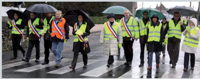
Marche du Conseil municipal pour la sécurité routière.

À l'issue de cette séance extraordinaire, tous les élus revêtus d'un gilet jaune de sécurité routière, le maire et les adjoints également ceints de leur écharpe tricolore, ont entamé une marche pour aller à la rencontre des