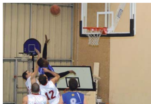
Demi-finale de la Coupe des Pyrénées.

Mais à la reprise, les Oloronais commençaient à durcir leur défense et expédiaient des