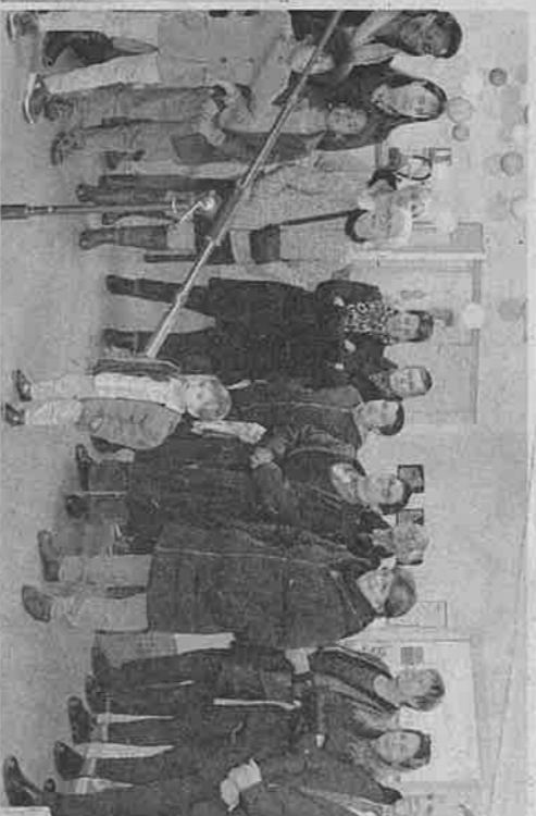
Les personnalités ont coupé le traditionnel ruban avant les discours qui ont été prononcés devant un auditoire attentif.