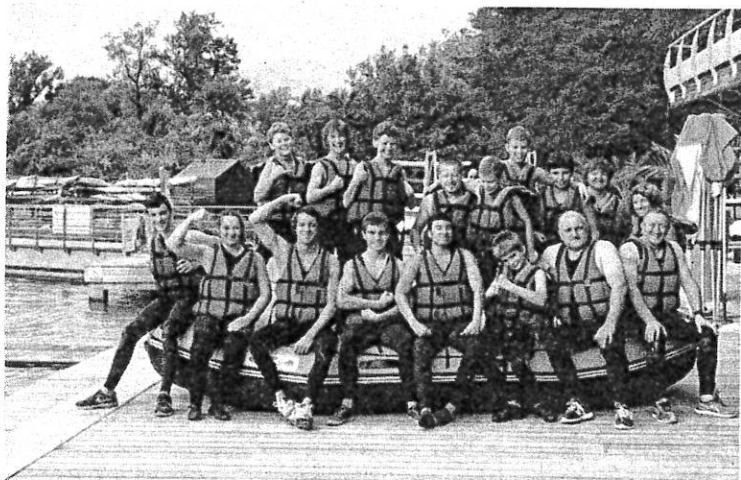
Après le VTT, le canoë kayak avant les tatamis.

Dans le droit fil de la rentrée des classes, le Judo club de Jurançon fait aussi la sienne. Pour que l'encadrement soit en pleine forme au seuil de la nouvelle année sportive, tous se sont retrouvés pour un week-end au grand air. Les animateurs, entraîneurs et professeurs du club se sont oxygénés en VTT sur le chemin Henri IV, avant d'affronter les tourbillons du