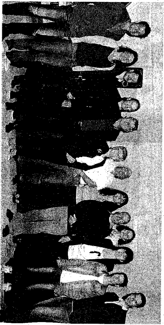
En présence de Tony Estanguet et d'Emilie Fer, les organisateurs en compagnie des personnalités et des responsables d'associations.

Au fil des mois, ce professeur des écoles a su s'entourer et convaincre de nombreux villageois. Du coup, toutes les associations de la commune ont tenu à lui prêter main-forte pour mettre sur pieds cette manifestation tout à fait exceptionnelle qui aura lieu les 23 et 24 mai.