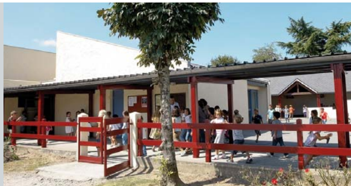
L'école publique ouvre ses portes aux enfants de l'IME

Ce dispositif sera d'abord « expérimental » jusqu'en 2013, mais les effets extrêmement positifs de cette mixité sont à coup sûr très enrichissants dans