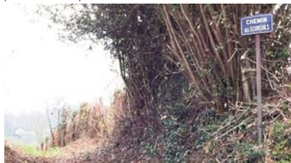
Le chemin des Écureuils

Tous ces sentiers pourront bientôt accueillir les promeneurs pour de nouvelles découvertes.