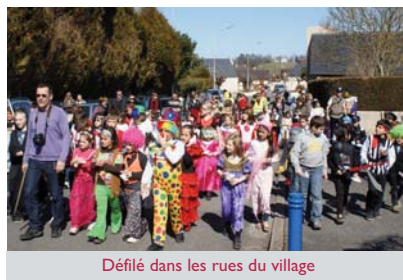
Défilé dans les rues du village

C'est alors que Sent-Pançard a été déchu et jeté en pâture à la vindicte enfantine. Condamné au bûcher, l'affreux Jojo a été brûlé au milieu de rondes improvisées par enseignants et écoliers avant le grand Goûter. ■