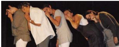
Café-théâtre avec la Cie D6Belles

Originaires de Bigorre, elles ont posé leurs bagages le temps d'une soirée théâtrale à Mazères-Lezons.