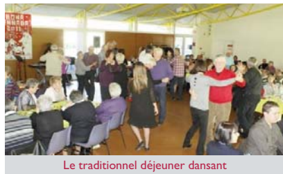
Le traditionnel déjeuner dansant

En guise de meilleurs vœux de bonheur et de santé, les Aînés ont été invités en janvier 2012 comme chaque année par le CCAS pour le traditionnel repas du Nouvel An : un dimanche de retrouvailles autour d'un déjeuner dansant et festif