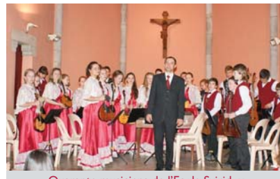
Quarante musiciens de l'Ecole Sviridov

L'orchestre s'est déjà produit en Europe et aux Etats-Unis... Et en Estonie il a remporté en 2011 le Grand Prix du Concours international de Tallinn. ■