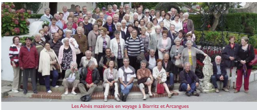
Les Aînés mazérois en voyage à Biarritz et Arcangues

Chaque automne, la migration des aînés Mazérois se renouvelle. Ce jeudi-là d'octobre 2011, la troupe a pris son envol vers la Côte Basque, précisément vers l'Aquarium de Biarritz, en bord d'océan face au Rocher de la Vierge. Sous la conduite d'un guide éclairé, les poissons tropicaux, les squales, les phoques, étoiles de mer, etc., ont régalé les yeux des visiteurs, des plus jeunes (petits écoliers) aux moins jeunes (grands retraités). Puis, d'un coup d'aile, cette migration s'est poursuivie autour d'un bon repas au Caritz, puis d'une libre balade (de gens heureux) en bord de mer, de la plage du Port Vieux à l'Hôtel du Palais, pour finir avec une virée vers le charmant village d'Arcangues, où repose Luis Mariano.