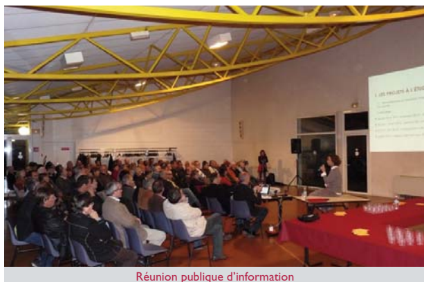
Réunion publique d'information

La soirée s'est prolongée avec un buffet campagnard autour duquel les discussions se poursuivent dans la convivialité.