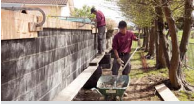
Construction d'un mur à la maternelle

En avril, les agents municipaux des services techniques ont érigé un mur de 100 mètres de long, en remplacement des clôtures grillagées, anciennes et abîmées, qui séparaient en mitoyenneté l'école maternelle des voisins du lotissement Larriau. De la belle ouvrage !