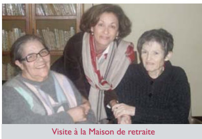
Visite à la Maison de retraite

La prochaine destination d'automne est déjà en cours de préparation... Ce sera une surprise... ■