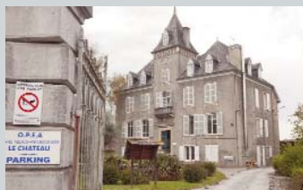
L'IME de Mazères-Lezons

Les lois sur le handicap prévoient des parcours diversifiés et spécifiques comme l'admission d'élèves en Institut médico-éducatif (IME) dans le système scolaire ordinaire.