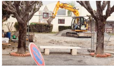
Changement d'une canalisation d'assainissement à l'école

En avril, les services de l'Assainissement de la communauté d'agglomération ont réhabilité une canalisation d'assainissement qui dessert l'école primaire, sur la Place Mendès-France.