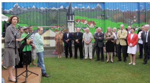
De nombreux maires sont venus inaugurer la fresque géante.

► Verygoodcolorz réalisait du 1 er au 15 mai une fresque géante encadrée par un cahier des charges pictural : l'œuvre devait représenter le village de Mazères-Lezons dans son environne-