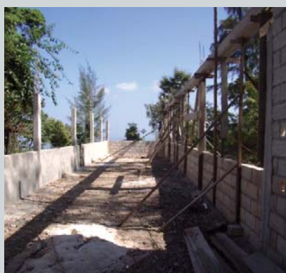
Le poulailler en construction...

« Votre don de 2 100 € a fait bien plus que les milliards promis et qui ne sont jamais parvenus en Haïti » ! C'est en ces termes émouvants que l'Association « Arc en ciel » chargée de suivre le projet de reconstruction d'un poulailler à Port-au-Prince a rendu compte de cette réalisation qui a pu être effective grâce à la donation de la Mairie au nom de tous les Mazérois, (cf. Mazères Lisons n°7). Ce don qui correspond à 1€ par habitant était modeste par rapport à l'ampleur du drame haïtien mais néanmoins important pour le budget de