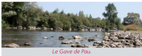
Le Gave de Pau.

À la suite de la réunion publique qui s'est tenue le 26 juin 2009 sur la transparence de la rocade, le comité de pilotage – formé par le Conseil général, le Syndicat Intercommunal contre les Inondations du Gave de Pau (SIGP), le Bureau d'études Hydraulique-Environnement et la municipalité de Mazères-Lezons – s'est réuni à plusieurs reprises.