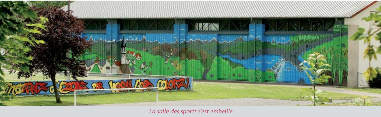
La salle des sports s'est embellie.