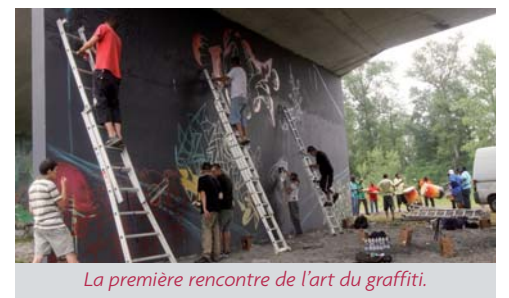
La première rencontre de l'art du graffiti.

Pendant deux jours, une quinzaine de graffeurs venus de tout le Sud-Ouest, de Toulouse à Montpellier en passant par La Rochelle, ont rivalisé en deux équipes pour faire une bataille ou «battle» en créant deux fresques face à face sous le pont de la rocade, l'une sur le thème du sport, l'autre sur le thème de la nature.