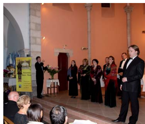
Un concert exceptionnel.

Le public conquis a accueilli avec enthousiasme ces merveilleux interprètes des œuvres du répertoire sacré ou profane et du folklore russe, et s'est laissé charmer par les prouesses vocales des soprani et des basses profondes.