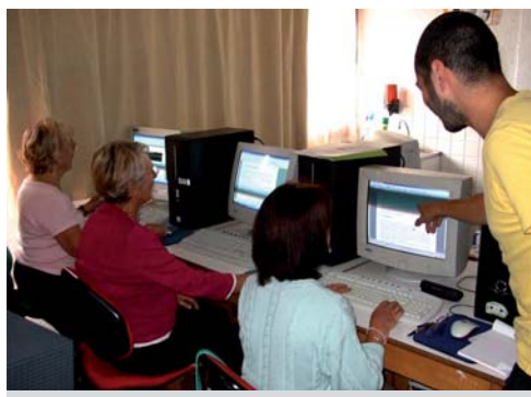
Les adultes s'initient à l'informatique.