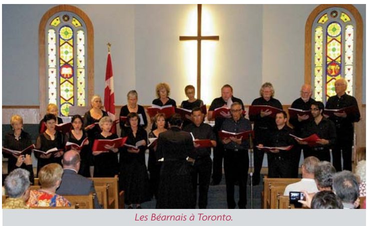
Les Béarnais à Toronto.