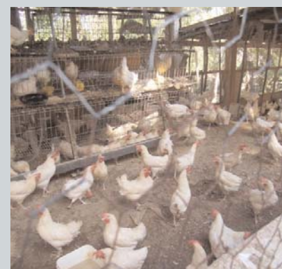
... pour élever des centaines de volailles.