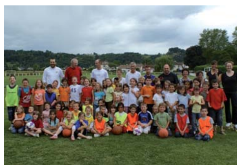
Les écoliers sur le terrain.

L'OMS de Mazères-Lezons a organisé le 11 juin la journée du « Sport à l'école ». Cette manifestation réunissait, sur les installations sportives de la commune, les enfants de l'école primaire et du centre médico-psychologique Le Château. La matinée était dédiée aux « 6-8 ans » et l'après-midi aux « 9-11 ans ». Les enfants ont ainsi pu découvrir et s'initier aux joies de la pratique sportive en participant à divers ateliers pédagogiques animés par les associations sportives mazéroises (Football, Basket-ball et Patinage). Une séance d'initiation aux premiers